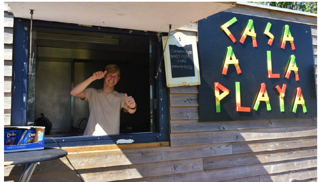
Casa à la Playa in de zomer

- Begin juni was de landelijke Week van de Jonge Mantelzorger . Dit kreeg vorm met een regionale aanpak: er waren digitale activiteiten en er werd persoonlijk een goodybag bij de jonge mantelzorger afgeleverd door de VSP'er en jongerenwerker van de betreffende regio.