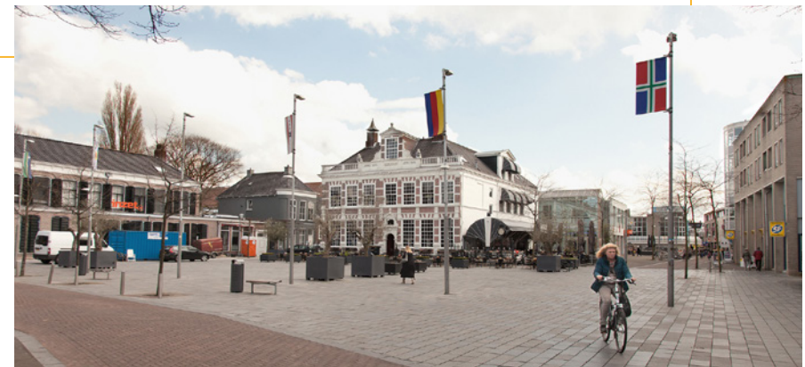
Heerenveen in Coronatijd, foto Joris Kalma, Omrop Fryslân